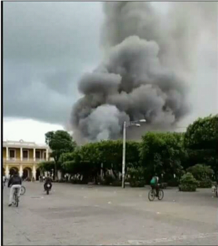
Des bombes pour jeter a la police