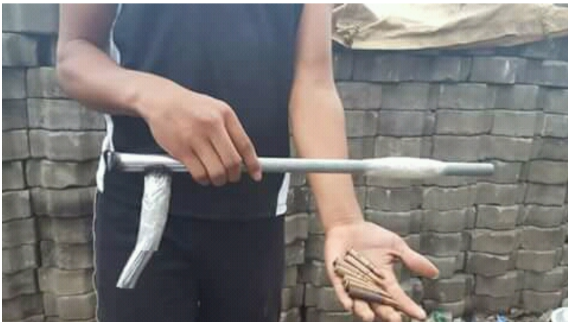
Gens Sandinistes attaqué par des manifestants