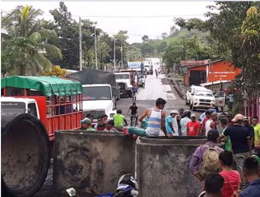
LA mairie brulé para des manifestants